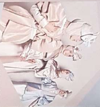
Koleksi Culture nua akan ditampilkan pada Jakarta Fashion Week 2021